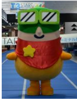
成田国際空港の マスコットキャラクター、クウタン