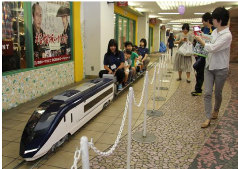
ミンスカイライナーの運行(イメージ)