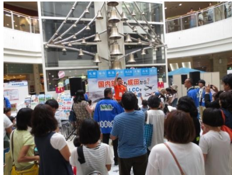
ジェットスターPR(イメージ)