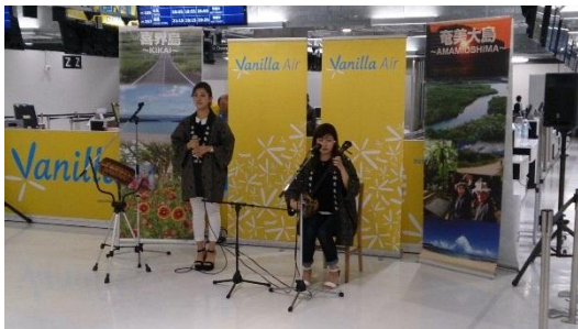
島唄ライブ(イメージ)