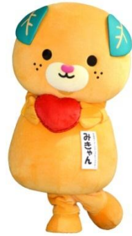
愛媛県の イメージアップキャラクター、みきちゃん