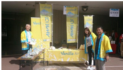
スタンプラリー(イメージ)