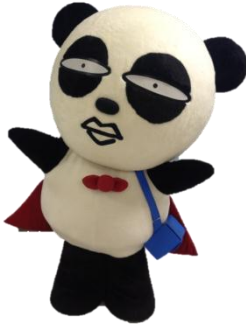
京成電鉄の マスコットキャラクター、京成パンダ