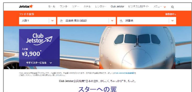
Club Jetstar トップページ