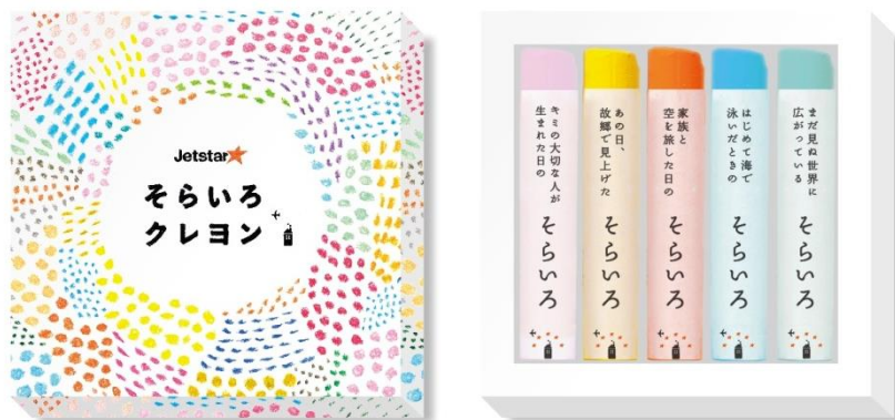
< ジェットスターそらいろクレヨンセット イメージ > 販売用 価格:¥850(税込) ※沖縄(那覇)のみ販売なし