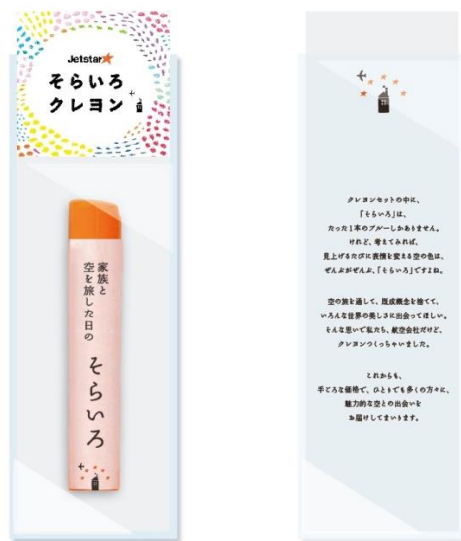
< ジェットスターそらいろクレヨン イメージ >