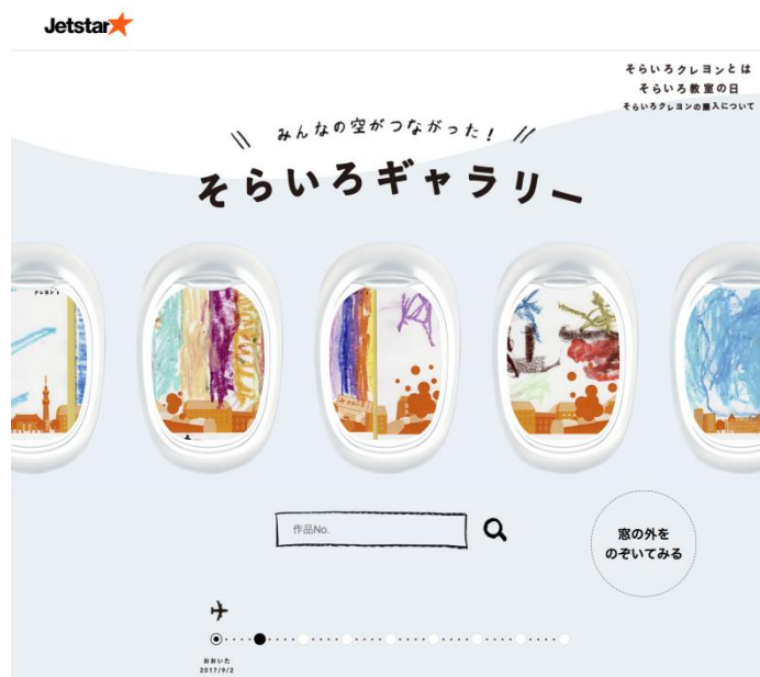
< ジェットスターそらいろクレヨンギャラリー イメージ >

URL: http://campaign.jetstar.com/sorairo/